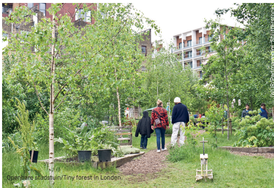
Openbare stadstuin/Tiny forest in Londen.

Onno Oosterhof, Strategisch Beleidsadviseur Ondergrond bij de Gemeente Haarlem