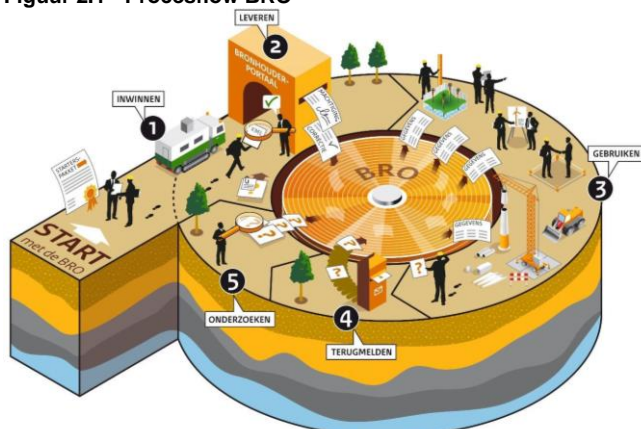
Figuur 2.1 - Procesflow BRO